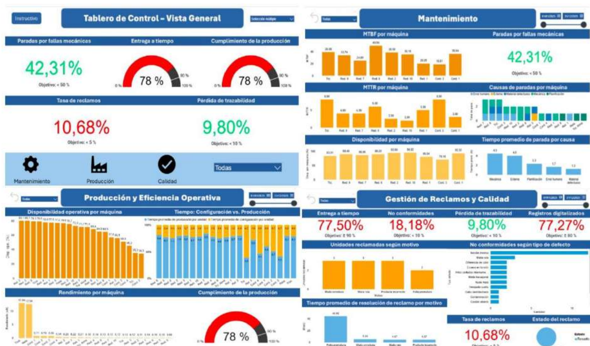
Figura 4 - Tablero de Control - Vista General (superior izquierda) – Mantenimiento (superior derecha) – Producción y Eficiencia Operativa (inferior izquierda) – Gestión de Reclamos y Calidad (inferior derecha).

Cada vista, como se observa en la Figura 4, combina gráficos y tarjetas que permiten tanto un monitoreo global como un análisis detallado de causas, favoreciendo la identificación de patrones, la detección temprana de desvíos y el soporte a la toma de decisiones en áreas críticas como la continuidad operativa, la calidad y el cumplimiento de entregas.